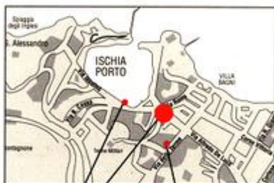
Terminal Aliscafi Villa Maria Ischia Thermal Center

Camere Rooms Tariffe Rates Parco termale Thermal park Bagno T. Pietro Home Home