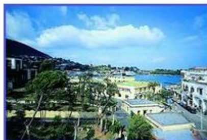
View of the harbour from the main terrace. Vista del porto dal solarium dell'albergo.