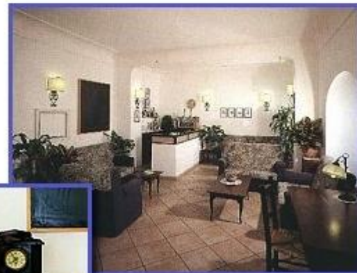
L'accogliente salotto che guarda sulla piazza Antica Reggia

Hotel Villa Maria P.za Antica Reggia, Ischia Tel.081992117 081984331 Fax 081981298 info@villamaria.it info@villamariaischia.it